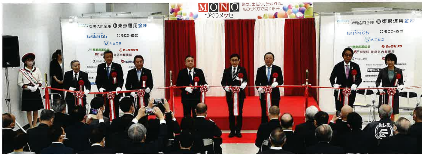
オープニングセレモニーでのテープカット

新型コロナウイルス感染症により第13回から昨年の第15回まで開催中止となった「としま MONO づくりメッセ」オープニングが、多数の来賓、招待者、出展者の参列のなか無事始まりました。開会の挨拶では、豊島区長職務代理者の齊藤雅人副区長の「コロナ禍や物価の高騰など厳しい経営環境を打開していくには、販路の拡大や企業間の交流、このような異業種の交流を含めた新たなマッチングが必要。」との言葉があり、テープカットが行なわれました。