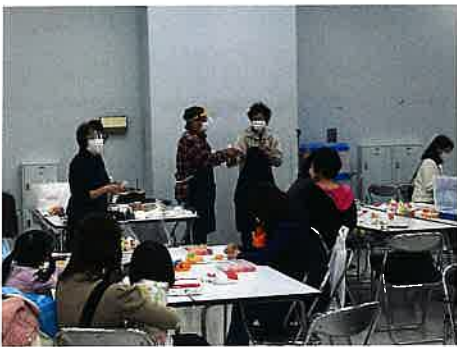
食品サンプル作成体験