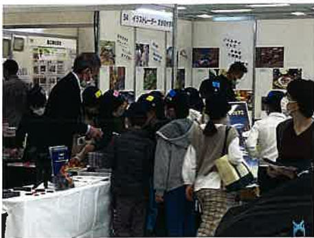
小学生の社会科見学