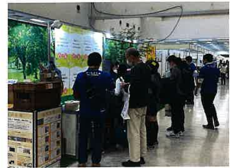
チームとしまブース