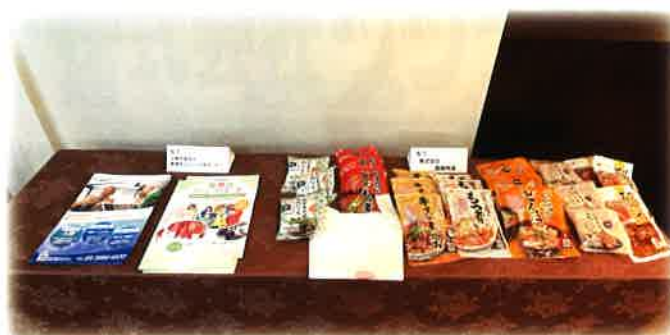
参加企業の展示品